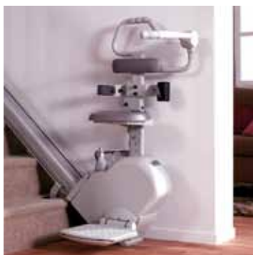
Globus Nova Sitt- eller Ståstol