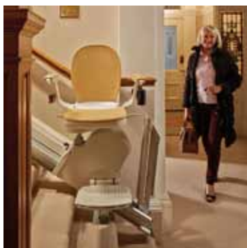
Globus Nova med fällskena

Produkterna på bilderna kan vara extrautrustade