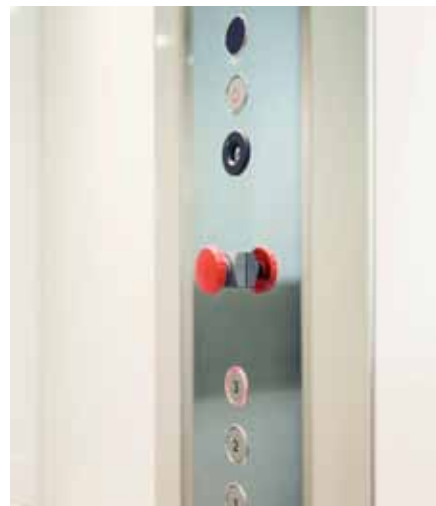
Produkterna på bilderna kan vara extrautrustade